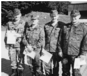
Das Team der Reservistenkameradschaft Ertingen siegte beim Qualifikationsschießen der Bezirksgruppen Stuttgart und Tübingen des Reservistenverbandes.

Spannende Wettkämpfe wurden bei bester Witterung auf der Standort-Schießanlage in Sigmaringen geboten, als die Bezirksgruppen Stuttgart (VBK 51) und Tübingen (VBK 54) dort ihr Qualifikationsschießen mit G3 und P I austrugen. Neunzehn Reservistenmannschaften rangen um die Auszeichnungen. Siegermannschaft wurde das Team der Reservistenkameradschaft Ertingen, den 2. Platz erreichte Esslingen vor Kirchheim/Teck.