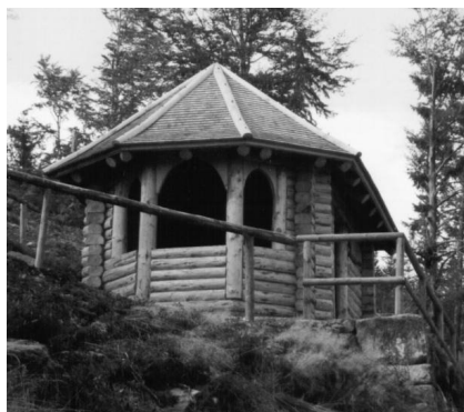
Die neue Aussichtshütte auf dem »Wildbader Kopf« bauten Bad Wildbader Reservisten nach alten Fotos wieder auf