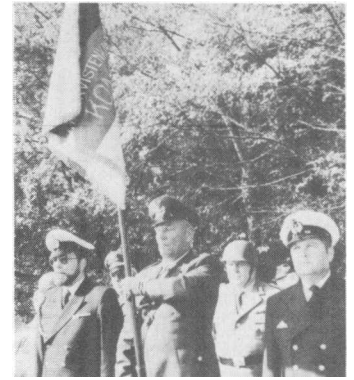
Ein Gottesdienst mit Fahnenweihe war der Höhepunkt der 20-Jahrfeier der RK Konstanz.