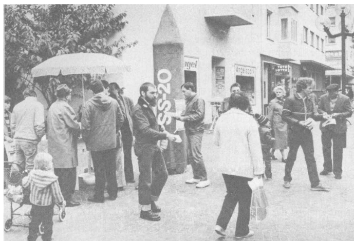
Für Frieden und Freiheit warben die Reservisten des Murgtals in der Gaggenauer Fußgängerzone.