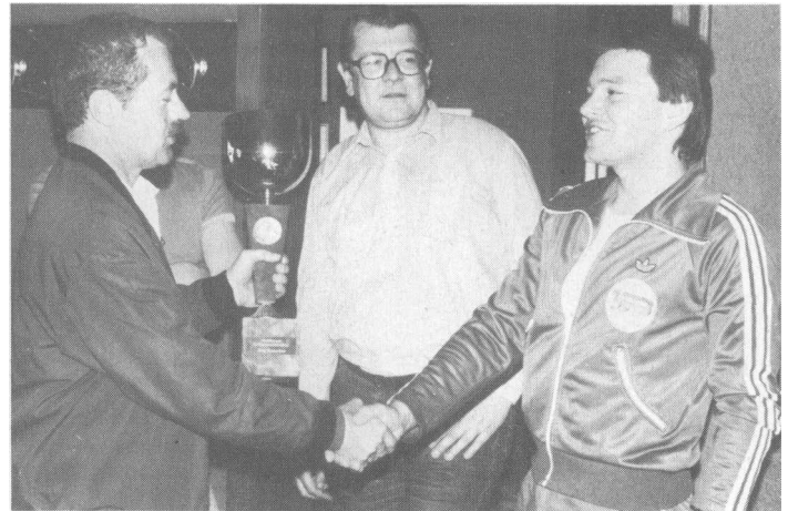
Am Hallenfußballturnier der Kreisgruppe Mittlerer Oberrhein nahmen insgesamt sechs Mannschaften teil, die sich für den Wettkampf im Gaggenauer Traischbachstadion qualifiziert hatten. Sieger und zum zweiten Mal hintereinander Gewinner des Wanderpokals wurde die RK Murgtal/Gaggenau I vor Ettlingen und Karlsruhe. Unser Foto: Kreisvorsitzender Pangratz überreicht den Pokal an den Mannschaftsführer der RK Murgtal/Gaggenau, in der Mitte der Schiedsrichter.