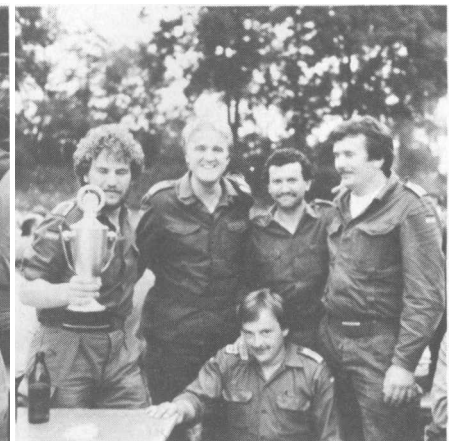
Snappschüsse vom Allgäu-Feldbiwak 1981: Rechts im Bild die stolzen »Pokalsieger«, links die Mitglieder des Landesvorstandes. Ganz links der Landesvorsitzende und Frau Ziegler.