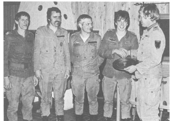
Beim 9. Orientierungsmarsch der RK Steinheim belegte die Mannschaft der RK Bietigheim (unser Foto) den ersten Platz, gefolgt von Markgröningen und Ludwigsburg. Beim 9. Steinheimer Orientierungsmarsch waren verschiedene Stationen anzulaufen und ein KK-Schießen zu absolvieren.