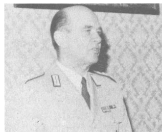
OBERST GEORG FREIDEL

Freiburg (GHB) — Beim Jahres-schluß-Seminar der Bezirksgruppe Südbaden stellte sich der neue Kommandeur im Verteidigungsbezirk 53 (Freiburg), Oberst Georg Freidel, den Amtsträgern der Bezirksgruppe vor. Freidel, aus Weil am Rhein gebürtig, freut sich, nun in seine engere Heimat zurückgekehrt zu sein.