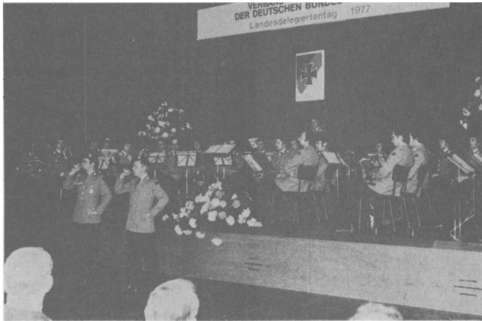
DER LANDESDELEGIERTENTAG in Stuttgart wurde musikalisch umrahmt vom großen Musikzug des Reservistenverbandes und von Jagdhornbläsern des Heimatschutzkommandos 17. Staatssekretär von Bülow - auf unserem Foto neben

Informationen der Landesgruppe Baden-Württemberg